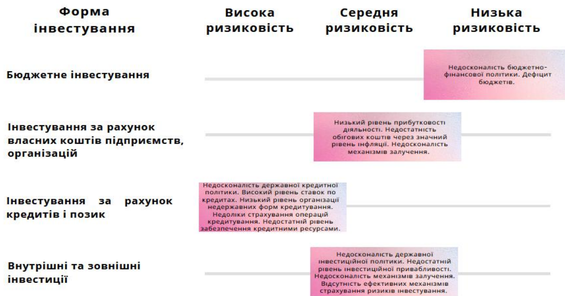
Рис.1. Форми інвестиційно-інноваційного забезпечення розвитку регіону

Форми інвестиційно-інноваційного забезпечення розвитку регіону за своєю квінтесенцією визначають джерело інвестування (1).