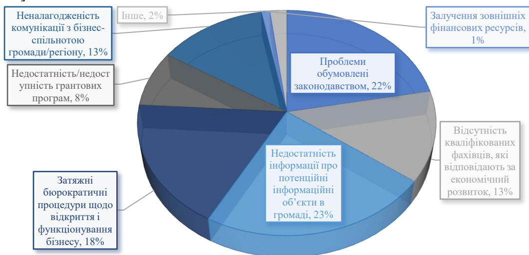
Рис. 2. Перешкоди залучення зовнішніх фінансових (інвестиційних) ресурсів для громади/регіону [6]

Зауважимо, що до основних перешкод нарощення регіонами ресурсної бази інвестицій можна віднести такі: корупція, адміністративні перепони для функціонування бізнесу, «недостатність інформації щодо потенційних інвестиційних об'єктів, які наявні в громаді (кадастр промислових земель, реєстр існуючих об'єктів нерухомості тощо); проблеми, які зумовлені недоліками у законодавстві (зокрема, часті зміни в нормативно-правових актах стосовно діяльності територій); тривалі бюрократичні процедури, які стосуються започаткування та функціонування суб'єктів підприємництва; брак кваліфікованих спеціалістів, які відповідають за економічний розвиток громади та залучення інвестицій; не налагодженість комунікації з бізнес спільнотою громади/регіону; недостатність/недоступність грантових програм [5, с. 42; 6, с. 317].