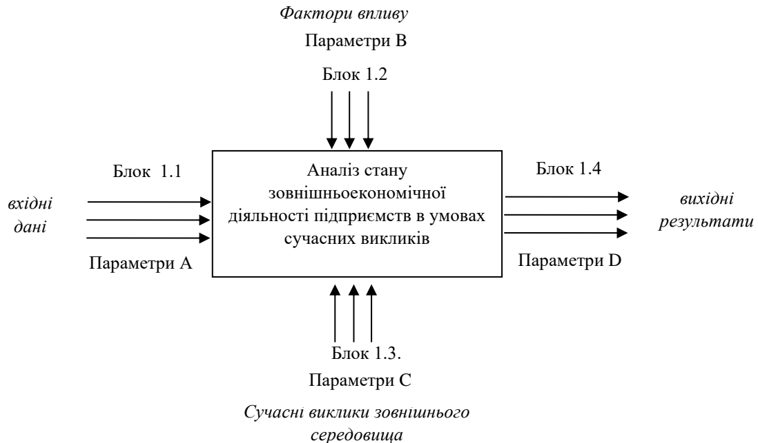
Рис. 2. Концептуальна модель аналізу зовнішньоекономічної діяльності підприємств в умовах сучасних викликів

Параметри А адаптовані до проведення комплексного дослідження діяльності, що передбачає розрахунок значимості експортно-імпортних операцій у загальних обсягах зовнішньої торгівлі, проведення аналізу трендів основних промислових груп товарів, встановлення пріоритетних географічних напрямків експорту-імпорту методами статистичного та порівняльного аналізу, аналізу ефективності ведення зовнішньоекономічної діяльності за цінovими та кількісними індексами умов торгівлі.