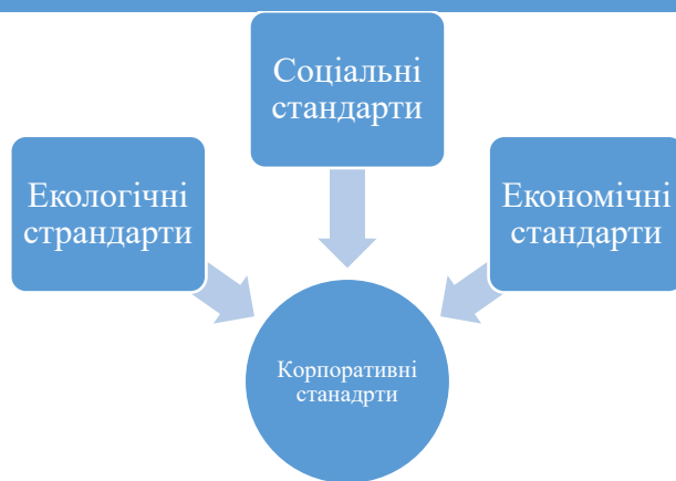
Рис.1. Концептуальний підхід до розробки стратегії бізнесу в рамках стандарту ESG.